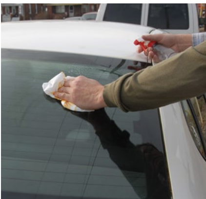
Clean. Cleans with a paper towel, leaves no ghosting.