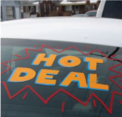
Mark. Marks on glass, and is rain and fade resistant.